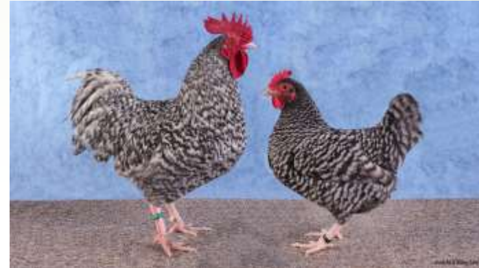
Geshopt oude type standaard